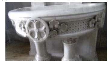
Fonte Bastimal - PRIVAS. Igreja de 1884